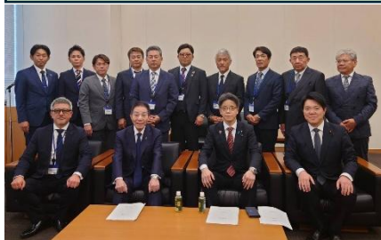
熊本建協玉名支部の皆さんと古賀誠先生を囲んで