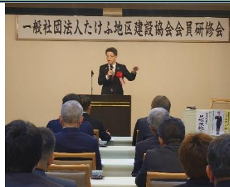
たけふ地区建設協会研修会にて講演