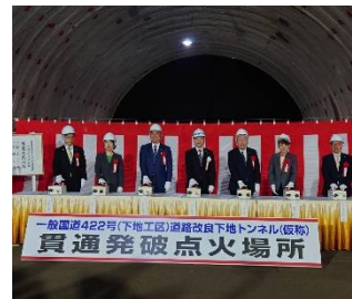
国道422号下地トンネル貫通式