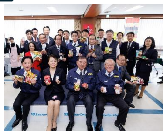
党災害対策特別委員会で災害備蓄食品等の展示会